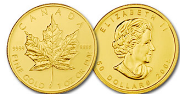
Emas di UOB Bank (jenama antarabangsa)