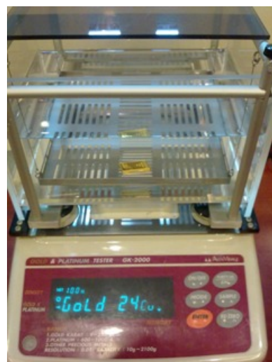
Ketulenan emas diukur menggunakan densimeter. Boleh test di kedai emas, Ar-Rahnu atau pejabat Public Gold.