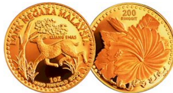
Syiling Kijang Emas (dijual di Maybank)