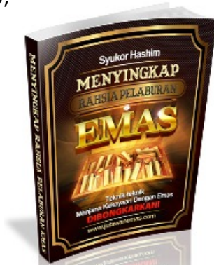
Panduan Terbaik Pelaburan Emas di Malaysia (RM80) http://bit.ly/ebookgold (Klik link di atas)