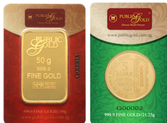
Emas Public Gold (standard LBMA)

Berdasarkan pengalaman saya, ini 4 jenama paling baik di Malaysia; (1) Public Gold, (2) Kijang Emas , (3) UOB Bank, dan (4) Kuwait Finance House. Selain empat jenama ini, ada banyak lagi , tapi ini yang paling berkredibiliti .