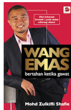
Buku "Wang Emas" (RM25) Dapatkan di kedai buku Popular atau order terus melalui Galeri Ilmu untuk pembelian cara poslaju.

[ILMU VS UNTUNG] Sejauh mana anda mampu menjana keuntungan bergantung sejauh mana ilmu anda tentang emas & perak. Saya sangat syorkan anda dapatkan kedua-dua panduan di atas sebelum bermula. Ia boleh elakkan anda daripada melakukan kesilapan besar.